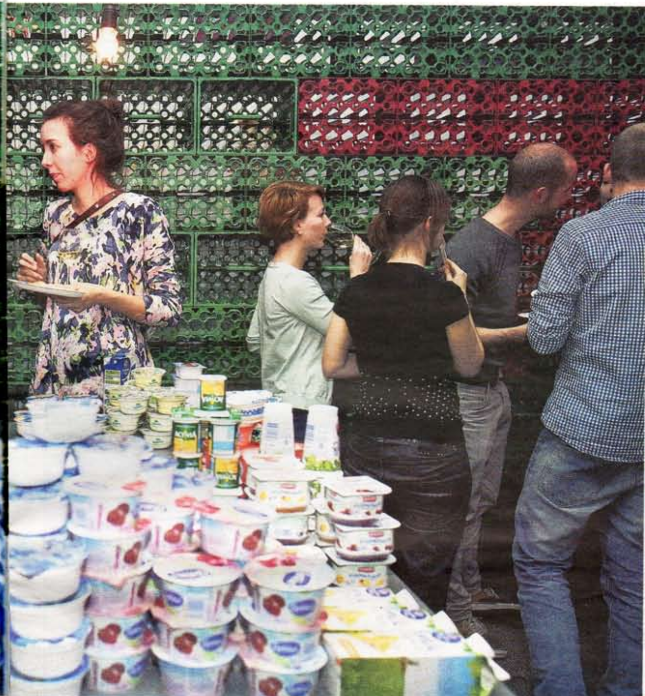
dat mijn groente verlept, trek ik er snel soep van en vries ik het in.'